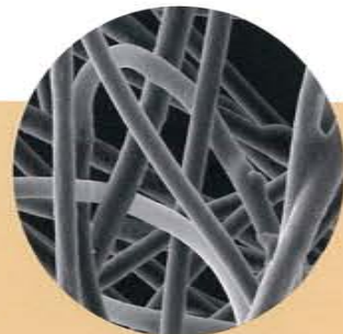
3M™ シンサレート™ 高性能中綿素材 顕微鏡拡大写真

3M™ シンサレート™ オフィス災害用コンパクト寝袋は、長年カジュアルやスキー、ワーキングウエアの中綿として使用されてきた信頼のブランド、シンサレート™ 製品を使用しています。複雑に絡み合った微細な繊維により、繊維間にできるだけ多くの空気を封じ込めるシンサレート™ 高性能中綿素材の技術によって、薄くても優れた保温性を実現します。