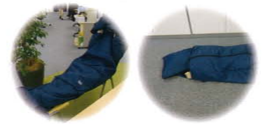
椅子に座りながら